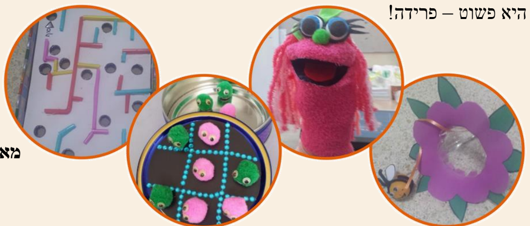
מאת: פנינה מאור

באופן אישי, בכל שנה-לקראת סוף השנה, אני נוהגת להכין עם תלמידי משחק ממוחזר. אני נוהגת לספר להם שאנו מכינות את המשחק לקראת הפרידה הקרבה שלנו, את המשחק התלמיד מקבל בשיעור האחרון שלנו כמתנת פרידה. לעיתים הפרידה היא רק לחופשת הקיץ ולעיתים הפרידה היא פשוט – פרידה!